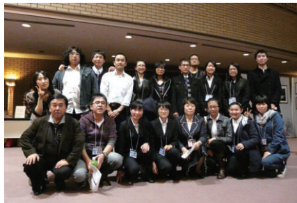
参加した中国人留学生の皆さん

富士大学の中国人留学生は今回この公演を支えるスタッフとして17名が通訳のボランティアとして協力しました。