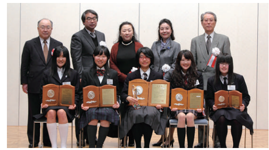
受賞者と選考委員の皆さん

【奨学金に関する問合せ】 日本学生支援機構奨学金返還相談センター 全国共通(ナビダイヤルにて) 電話: 0570-03-7240 (土日祝日・年末年始を除く)