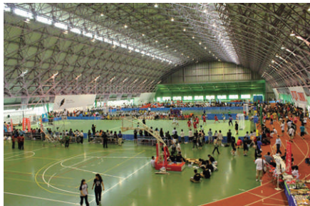
インターハイ時のセンター内

昨年は東日本大震災のため、3月12日から4月17日まで臨時休館となり、3月、4月の利用者が激減しました。平成21年度から3年連続で開催が予定されていた「全国高等学校ハンドボール選手権大会」も残念ながら中止となりましたが、7月には「全国高等学校総合体育大会ハンドボール競技大会」が開催され、高校生の若さあふれるプレイが希望と勇気を与えてくれました。