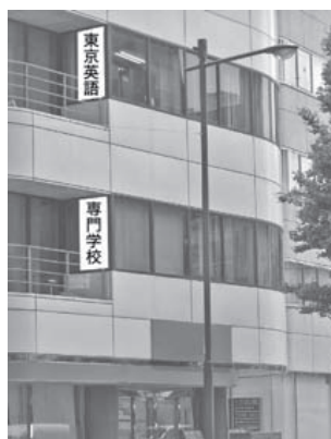
神田・秋葉原駅方面から来たときの TES 校