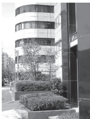
小伝馬町から秋葉原方面を見た TES 校