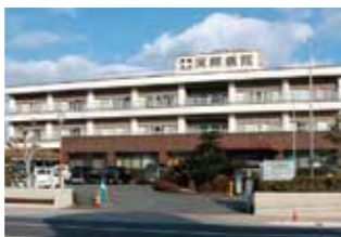
医療法人松籟会 河畔病院