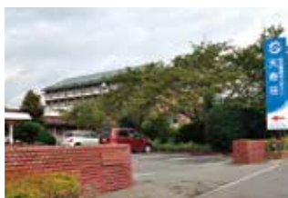
特別養護老人ホーム 天寿荘