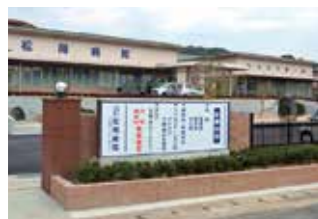
医療法人正友会 松岡病院

学校法人緑生館の理事は、主に佐賀・福岡県内の医療・福祉施設の理事長等で構成されていて、学生の生活・学習・就職をサポートしています。