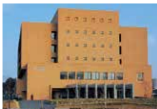
医療法人清明会 やよいがおか鹿毛病院