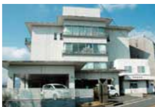
医療法人剛友会 諸隈病院