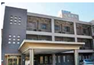
医療法人松籟会 松籟病院