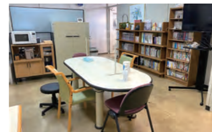
保健管理センター

建物は2階建てで、臨床系講義に使用します。2階に264席を有する大講義室があり、学生の授業のほか、学術講演会や各種研修などにも利用されています。