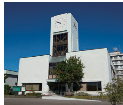
図書館 (医学部分館)

医学部図書館は、自然科学系統の中でも主として医学・看護学分野の資料を収集しており、図書約13万冊、雑誌3千誌を所蔵し、教育・研究・診療活動を支援しています。学生のみならず、授業・実習で学ぶ以外に、予習・復習やレポート作成など様々な用途で図書館を利用しています。