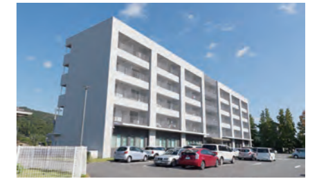
レジデントハウス「南風」

平成27年4月から稼働している第二病棟は、免震構造となっており、また、ヘリポート、避難スロープを設置しており、安心して療養・治療を受けられます。