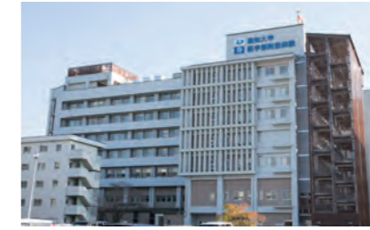
附属病院 第二病棟

解剖実習や、顕微鏡を使った実習などをはじめとする基礎医学の様々な実習が最新の設備を使って行われます。