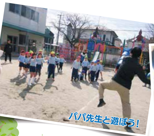
パパ先生と遊ぼう!