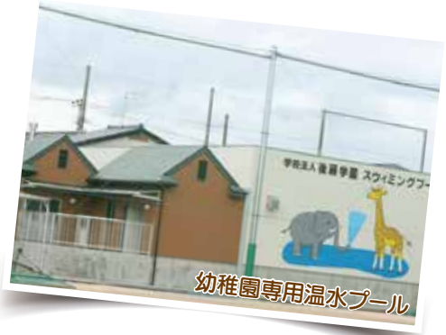
幼稚園専用温水プール