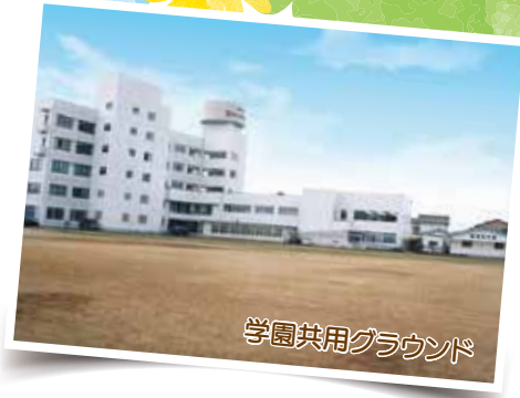
学園共用グラウンド