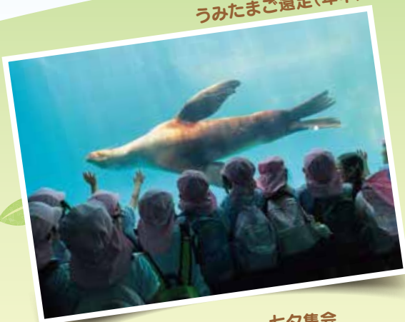
うみたまご遠足(年中)