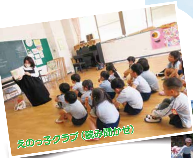
えのっ子クラブ (読み聞かせ)