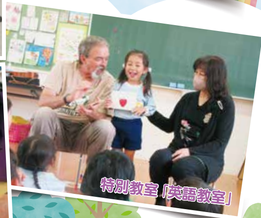
特別教室「英語教室」