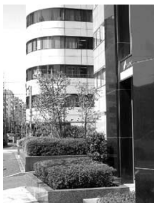
小伝馬町から秋葉原方面見た TES 校