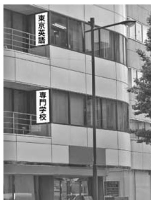
神田・秋葉原駅方面から来たときの TES 校