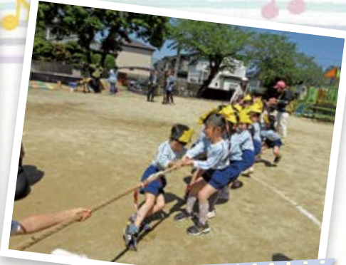
こどもの日のお祝い