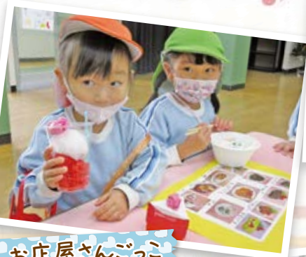
お店屋さんごっこ