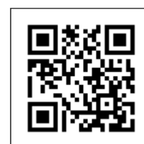
沖国大ポータル CampusSquare QRコード