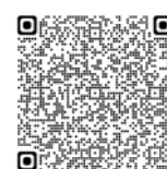
教育研究用複合機 プリンタ追加手順