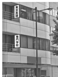
神田・秋葉原駅方面から来 たときのTES校